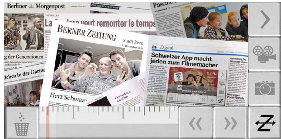
Software 'Zeitmaschine-App'; einige Ausschnitte aus Medienberichten. 19