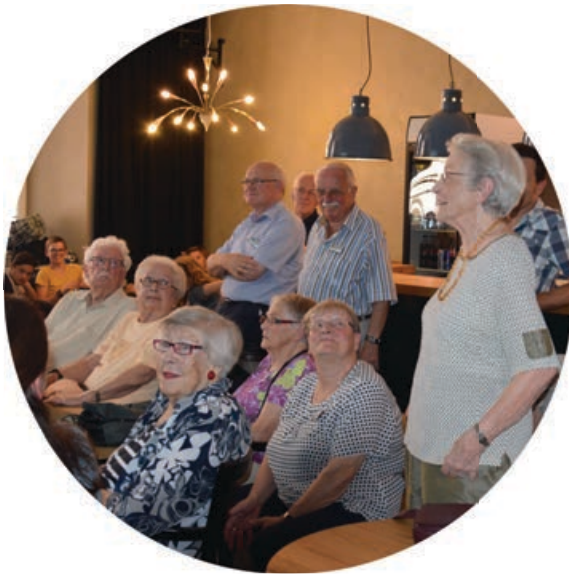
Clip-Show im Berner Generationenhaus, 2016