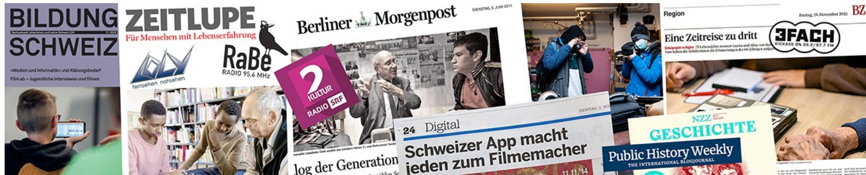
Illustration: Einige der Medien, die bereits über «Zeitmaschine bauen!» berichtet haben sowie Einblick in einige der Beiträge.

Der Pressespiegel zeigt die Interdisziplinarität des Generationenspiels. Er beinhaltet alle relevanten Medienbeiträge zum Generationenspiel seit der ersten Umsetzung im Herbst 2008. Diese reichen von Artikeln in Fachpresse und Tageszeitungen bis zu Beiträgen in Radio, TV und Online-Medien. Im online-Pressespiegel sind alle Beiträge chronologisch und nach Mediengattungen sortiert abrufbar. Medienberichte zu einzelnen Umsetzungen finden sich auch auf den einzelnen Projektseiten.